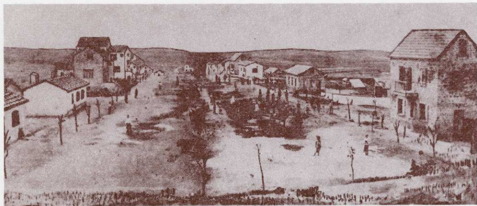
בתיה הראשונים של ראשון לציון משנת תרמ"ג (1883)