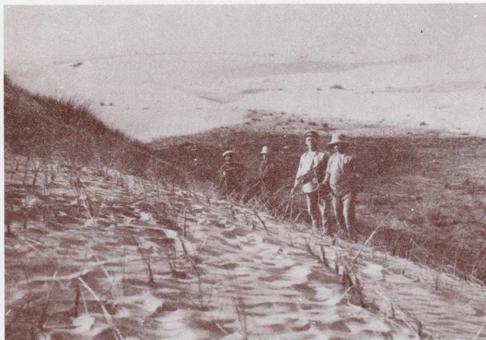
מעינות "עיון-קרה" ליד החולות