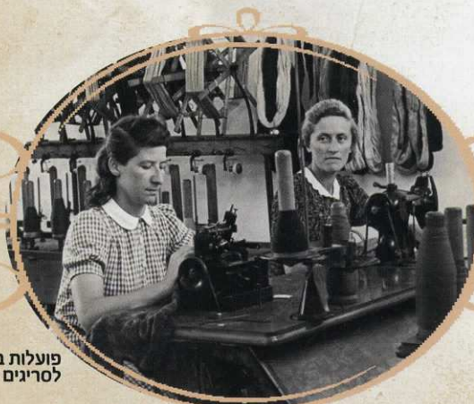
פועלות בבית החרושת לסריגים "צדק", 1942

נשות המושבה התערו בארץ-ישראל ותרמו את חלקן למען התפתחות היישוב העברי בארץ. על אף שלא כל הנשים שהגיעו לכאן היו בעלות מטען לאומי ואידאולוגי מובהק, החיים בארץ והאתגרים החדשים שעמדו בפניהן הביאו אותן לקיים בפועל את האידאולוגיה הציונית ולהפנים את החידוש שבחיים העבריים בארץ ישראל, אישה אישה על פי יכולתה וכישוריה. הן השכילו לגדל דור של "יהודים חדשים" ו-"צברים" שבהם נטעו ערכים של אהבת האדמה, העם והארץ ושאיפה לעצמאות לאומית. הנשים הללו, שהיו שותפות פעילות לתקומת עם ישראל בארצו, הניחו את היסודות להעצמת האישה ולשיפור מעמדה בראשון-לציון ובארץ ישראל.