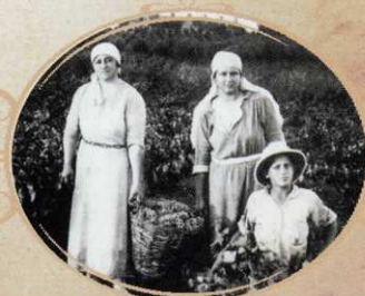
משפ' הירשפלד בכרם